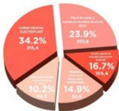
Contribuția fiecărui domeniu de activitate în cifra de afaceri cumulată (mii RON) a Holdingului (preliminar 2025)

Din totalul veniturilor de 629,5 mil. RON înregistrate în 2025, o pondere de 79,8% (502,4 mil. RON) o au vânzările către clienții din România, restul vânzărilor fiind generate în special de Grupul BICO cu parteneri externi, din țări precum Italia, Germania, Grecia, Polonia, Bulgaria, Portugalia sau Croația.